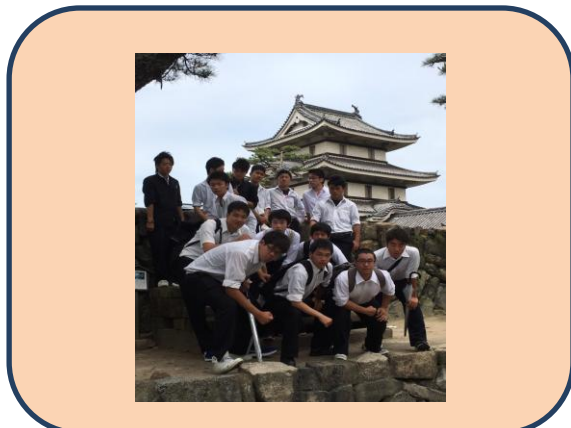
「入港中は、高松城跡玉藻公園の見学と名物讃岐うどんを堪能してきました」