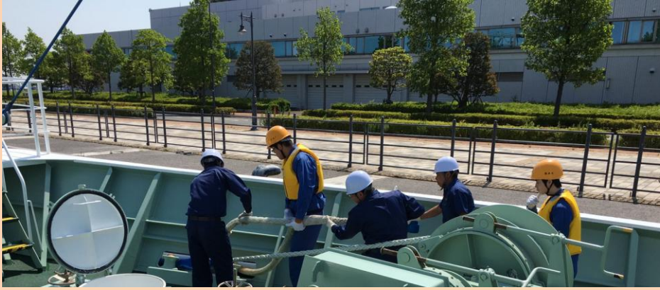
横浜港 入港作業中 横浜港新港 5 号岸壁に着岸 「赤レンガ倉庫の目の前に着岸しました」