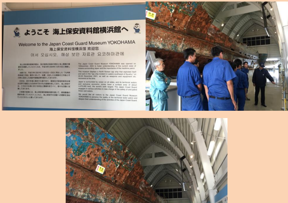
「写真は、2001 年に東シナ海で巡視船と交戦の末、沈没した不審船です」